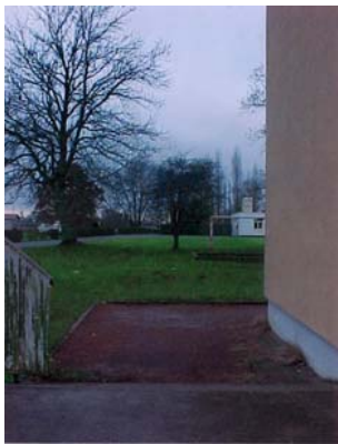
Les trois propositions de Jean