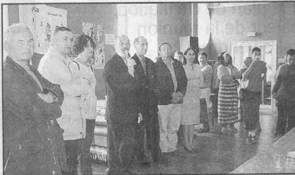
Les élus ont visité l'exposition

Pendant 3 jours « l'enfance en fête » a connu un franc succès. Pour réussir ce grand rendez vous de la solidarité au service de l'enfance 25 associations ont uni leurs efforts.