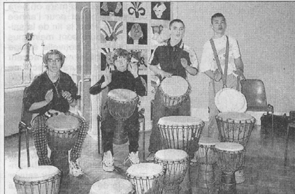
Les enfants de l'IME ont initié leurs petits camarades des écoles d'Azay et de Saint-Maixent au Djembé