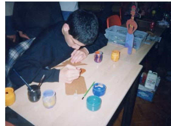
Atelier peinture sur bois