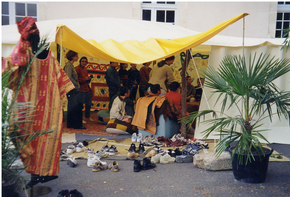
Entrée de la tente