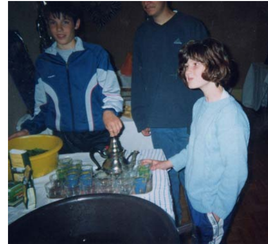
Préparation du thé