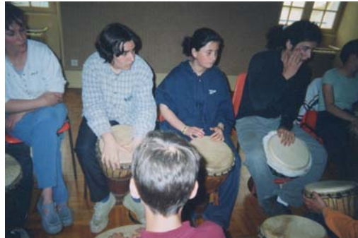
Atelier percussions Le grand masque fabriqué par l'atelier métal de l'IME