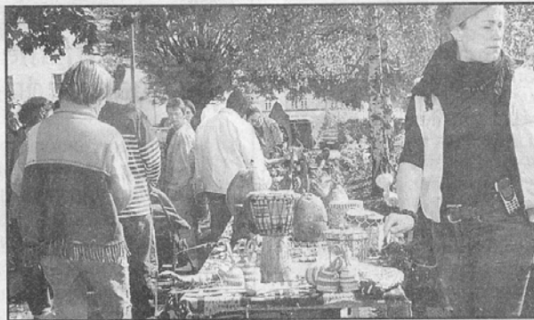
Le marché africain a attiré le public

coordonnateur de cette fête, a mis l'accent samedi sur « les droits de l'homme, l'appel à la tolérance. Pour le moment, il n'est pas question de relâcher nos efforts. Un certain nombre d'innovations font suite à l'opération de l'année dernière ». Autour de réflexions collectives consacrées à l'Enfance d'année en année, le programme festif évolue et de nouvelles associations caritatives rejoignent la manifestation annuelle. « La bande dessinée de l'IME de Villaine vendue en direction du Tiers-monde a permis de concrétiser deux types d'opération. Ainsi le village d'Abado Kpognédé sera équipé en mobilier. Et