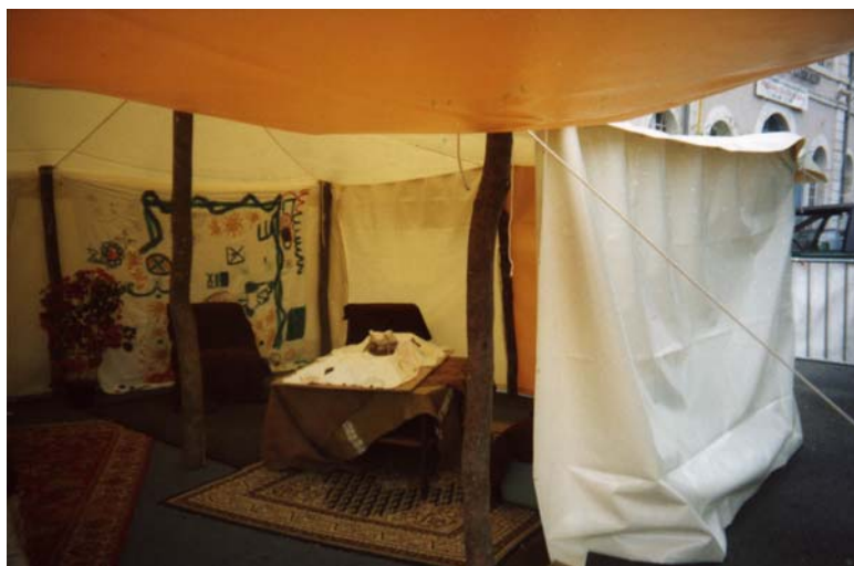
En face, le salon